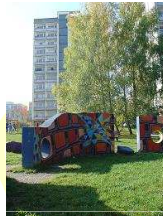
Banská Bystrica - Fončorda: pred, počas a po úpravách v r. 2008