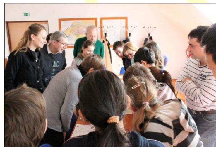
Banská Bystrica – Sásová: začínajúci projekt Pink Park (Ružová ul.)