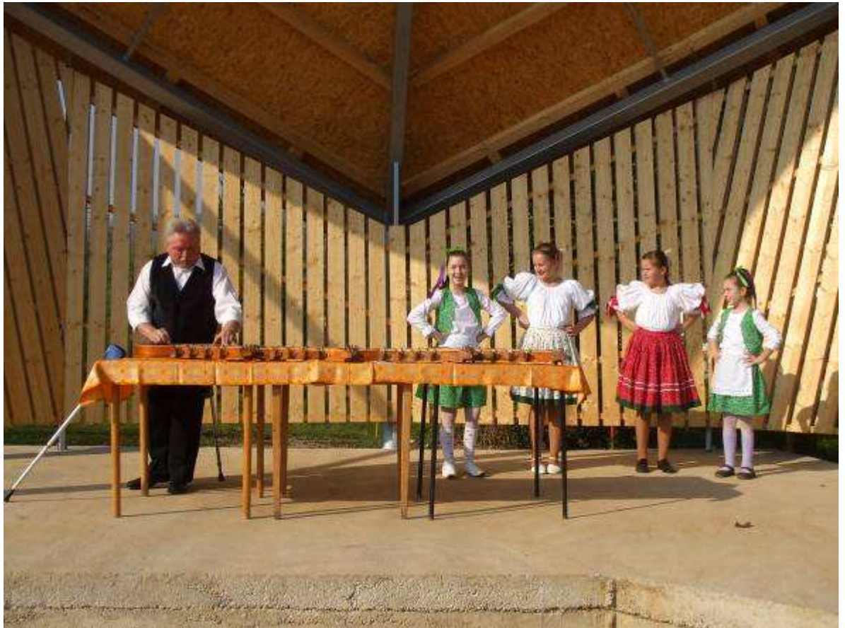
Priestor po úpravách