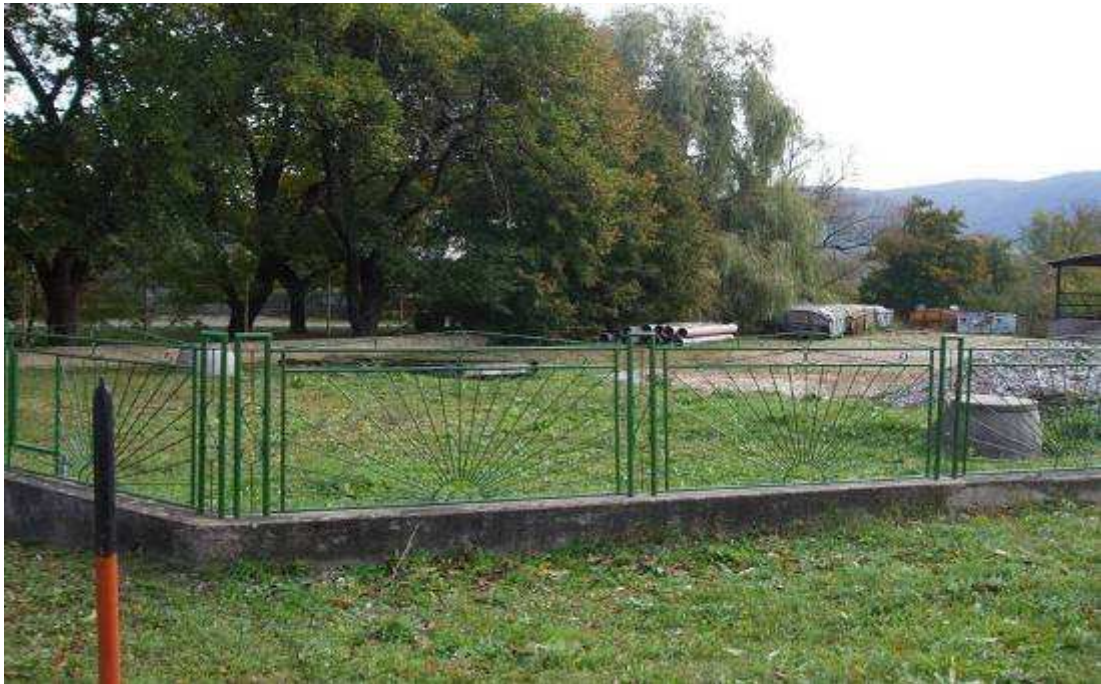
Hore - priestor pred úpravami; dolu - počas slávnostného otvorenia (tesne pred dokončením úprav)