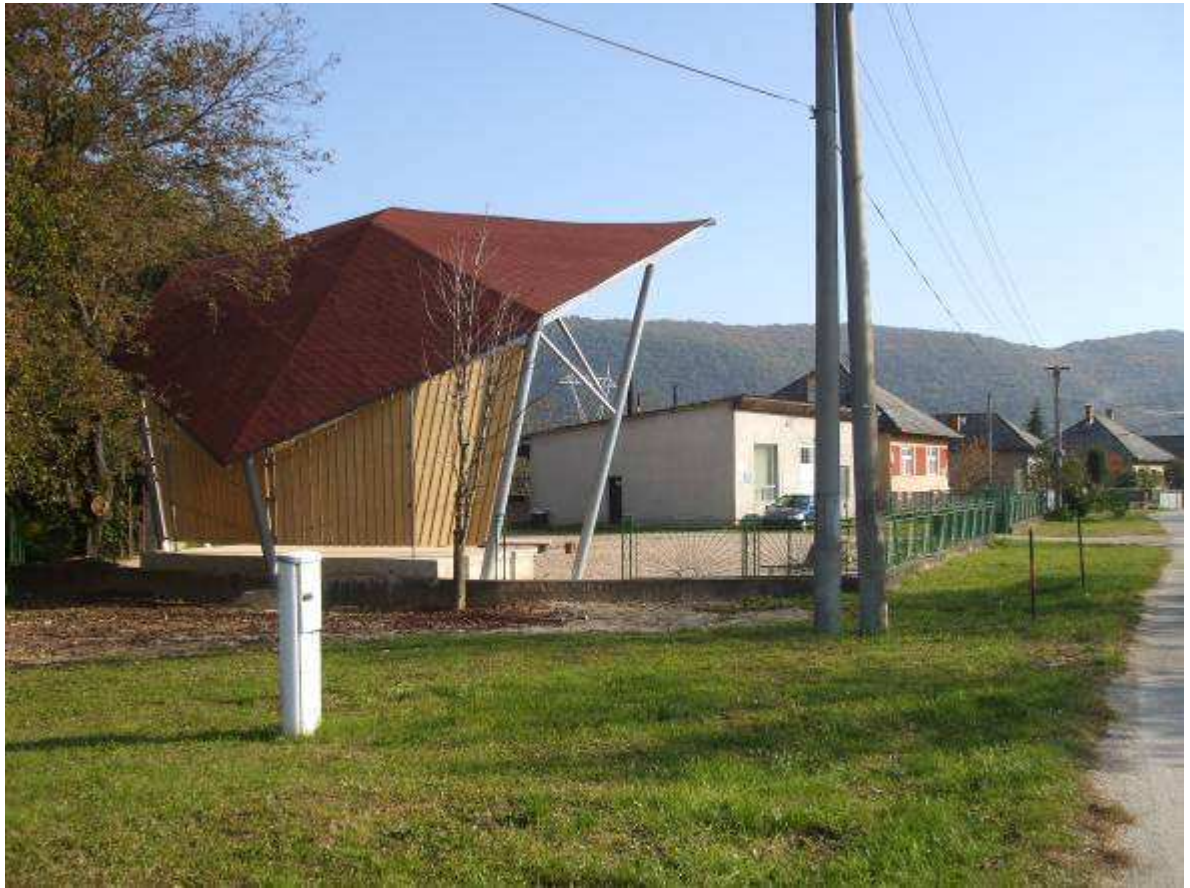
Priestor po úpravách