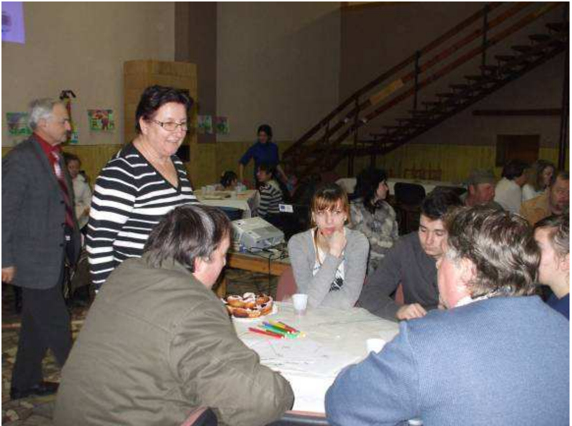
Plánovacie stretnutia v Hrušove