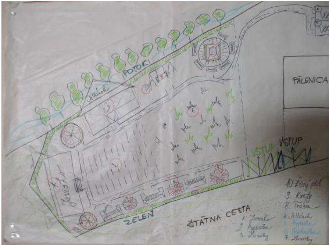
Návrhy od občanov z prvého a druhého plánovacieho stretnutia