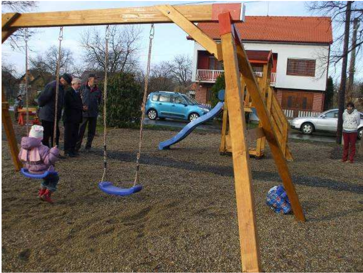
Priestor po úprave – detská zóna