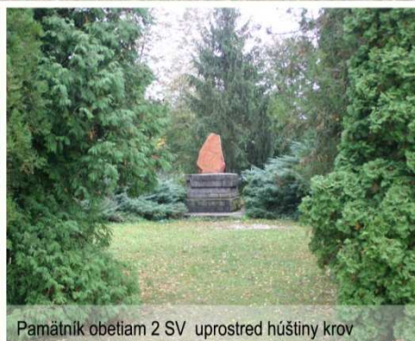
Pamätník obetiam 2 SV uprostred húštiny krov