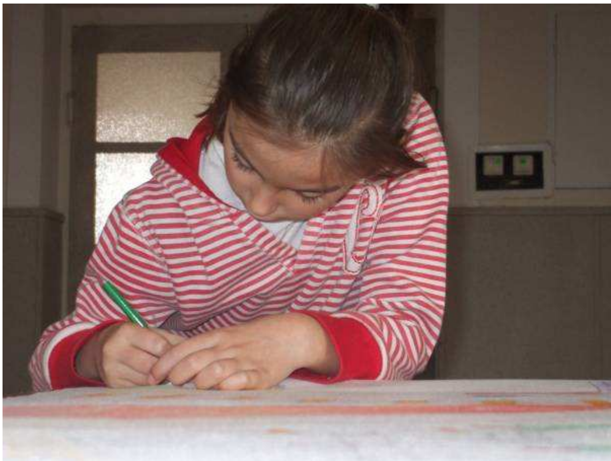
Plánovacie stretnutie – tvorili aj deti a tínedžeri. Vytvorili svoj vlastný návrh.