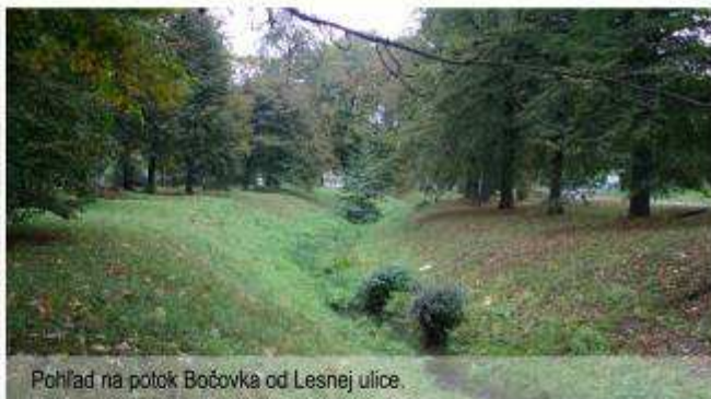
Pohľad na potok Bočovka od Lesnej ulice.