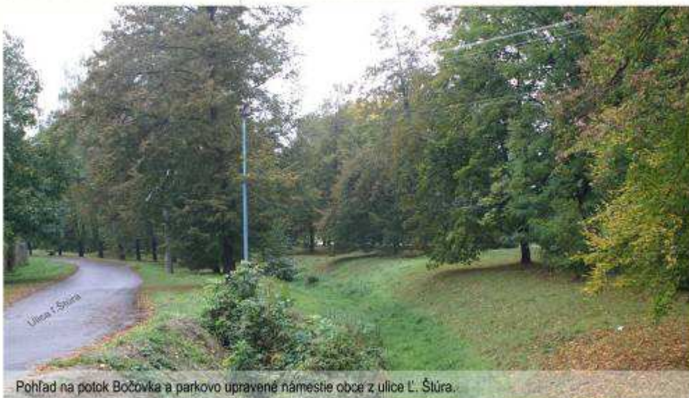
Pohľad na potok Bočovka a parkovo upravené námestie obce z ulice L. Štúra.