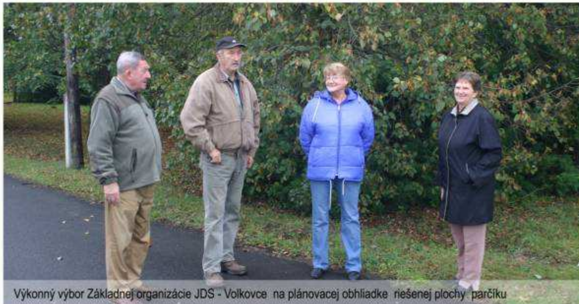
Výkonný výbor Základnej organizácie JDS - Volkovce na plánovacej obhliadke riešenej plochy parčíku