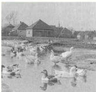
Náves s potokom pred úpravou