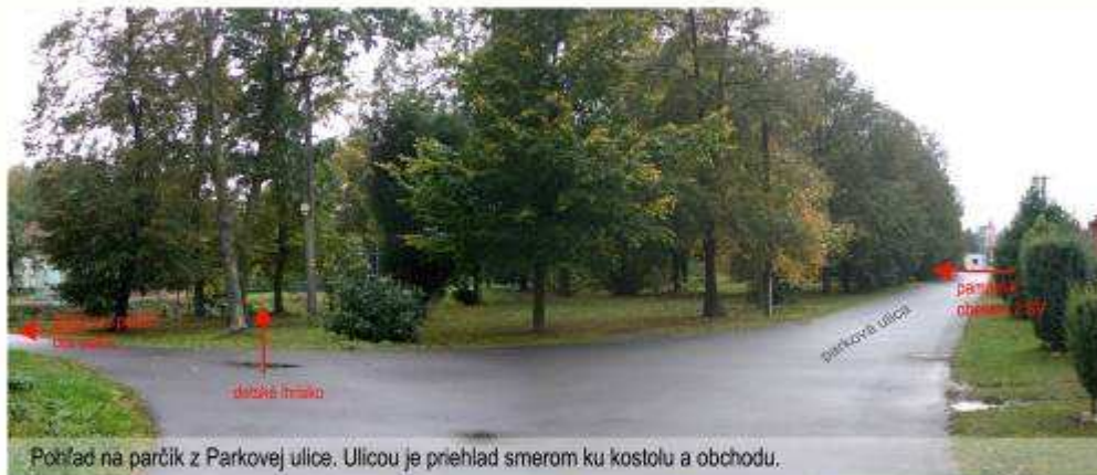
Pohľad na parčík z Parkovej ulice. Ulicou je priehľad smerom ku kostolu a obchodu.