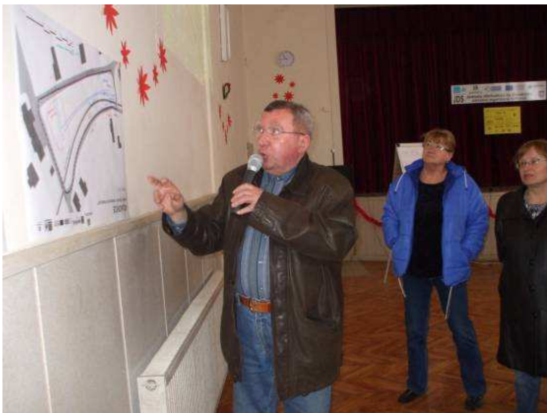
Prvé plánovacie stretnutie – prezentácia výstupov zo skupiniek.