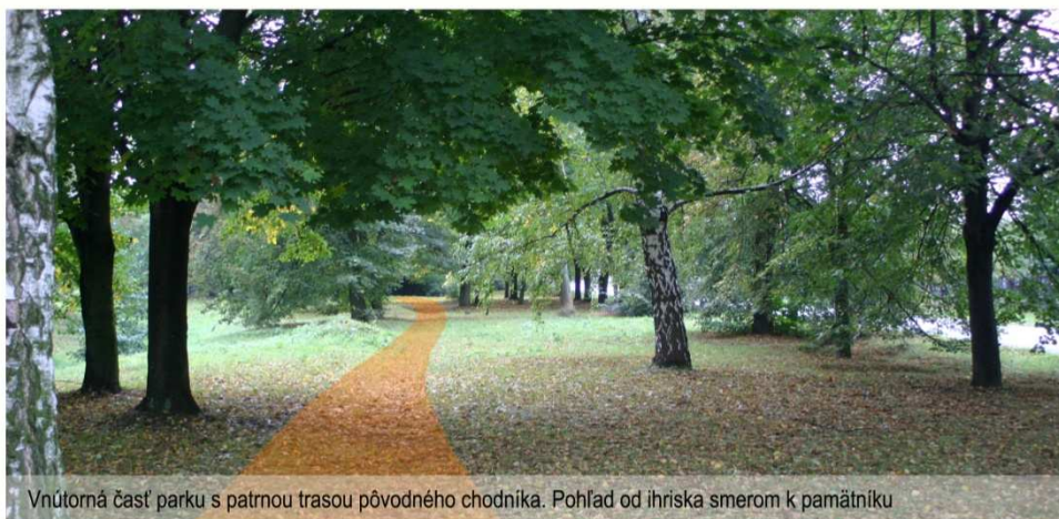
Vnútorá časť parku s patnou trasou pôvodného chodníka. Pohľad od ihriska smerom k pamätníku