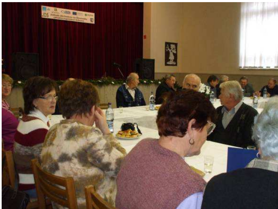
Slávnostné ukončenie projektu v priestoroch kultúrneho domu