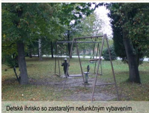
Detské ihrisko so zastaralým nefunkčným vybavením