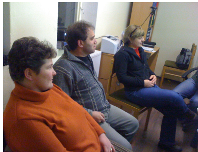
Stretnutie projektového tímu