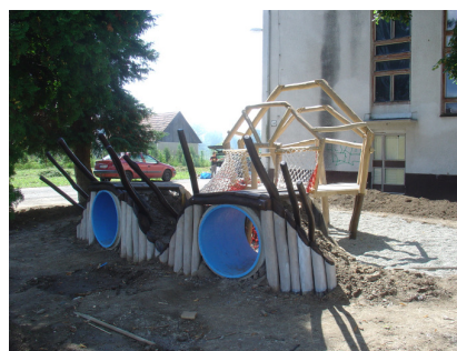
Oko vidí – mozog myslí

Vychádzajúc z plánov úprav zakreslených v architektonickej štúdii, v rámci prvej etapy projektu, sa nám podarilo uskutočniť základné úpravy terénu na celej ploche areálu a vytvoriť dve ucelené oddychovo-zábavné zóny určené predovšetkým deťom a mládeži. Vznikol priestor pre vychádzky pre materskú školu, mamičky s deťmi aj deti samotné – detská preliezka „Oko vidí, mozog myslí“ a priestor pre trávenie voľného času mladých ľudí – lanový park – ktorý zároveň rozvíja ich motoriku a fyzickú zdatnosť.