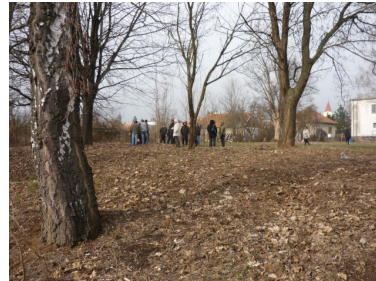
obhliadka terénu – plánovacie stretnutie

Predmetom projektu Umelecká záhrada je pozemok s celkovou výmerou 3987 m 2 . Ide o dve parcely, nachádzajúce sa v bezprostrednom okolí budovy kultúrneho domu, ktoré dostalo Divadlo Pôtoň do dlhodobého prenájmu od obce Bátovce. Celý areál je situovaný na okraj obce, medzi zástavbou rodinných a bytových domov (z nich časť je využívaná chalupármi). Zároveň je však od centra obce vzdialený iba 700 metrov. Priestranstvo pretína účelová asfaltová komunikácia (príjazd k ČOV) a je pokryté pôvodným trávnatým porastom a čiastočne stromami. Nerovný terén najčastejšie navštevujú majitelia psov z okolitých bytových domov, ktorí ho využívajú ako výbeh pre svojich miláčikov. Areál kultúrneho domu je obľúbeným miestom aj pre prechádzky niektorých obyvateľov, je dostupný širokej verejnosti (nie je ohradený), je relatívne blízko obyvateľom zo všetkých častí obce a jeho okolie je pokojné a tiché.