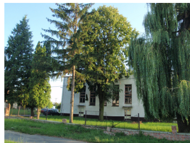
Pohľad na prednú časť záhrady, 2009

Keď sme v roku 2008 získali pre našu prácu priestory kultúrneho domu v pokojnom, príjemnom a zelenom prostredí na okraji obce, uvedomili sme si potenciál, ktorý predstavuje okolie budovy. Začali sme uvažovať o spôsoboch, akými by sa dal upraviť verejný priestor, dostupný všetkým obyvateľom obce, ako ho skultivovať s pomocou a v prospech komunity, aj preto, že je pre nás „prišielcov“ dôležité byť skutočne užitoční pre samotnú obec